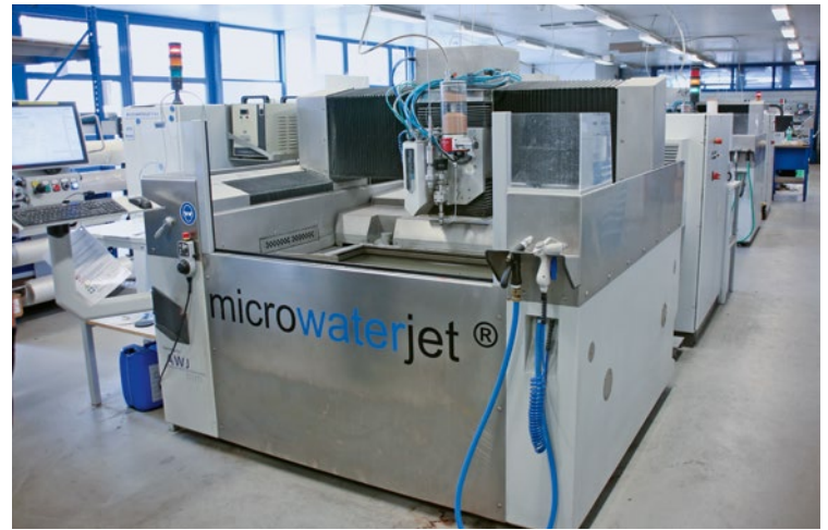
Seit dem Jahr 2001 ist die Waterjet AG auch im Mikrobereich erfolgreich.